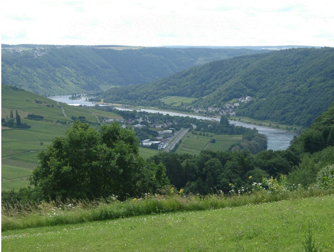
Ferienwohnung Moselblick | Rudolf Hochscheid