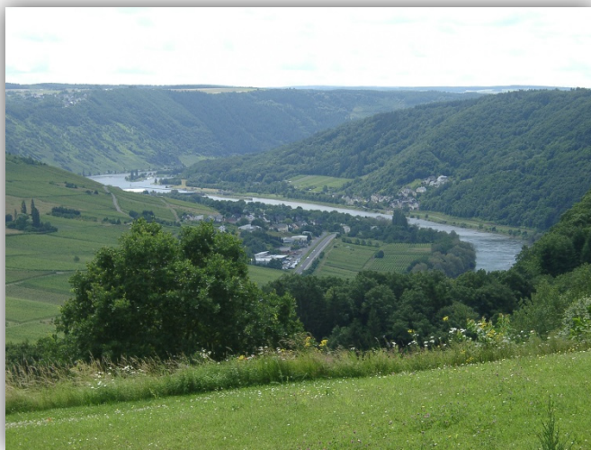
Ferienwohnung Haus Moselblick